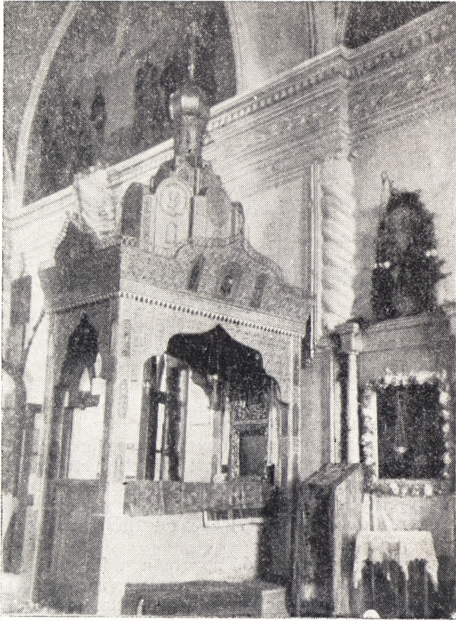
РАКА СО СВ. МОЩАМИ ПРЕП. НИЛА

именуемая «Скоропослушница». Она привезена с Афона в 1872 г., одновременно с иконой св. великомученика Пантелеимона.